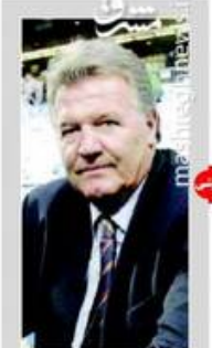
دستور ۱۶ میلیاردی راننده جدید اتوبوس نوسازک روی دست کی روش

مذاکرات روحانی و پوتین درباره برجام، همکاری‌های اقتصادی و سوریه.