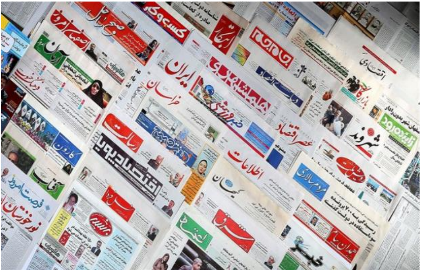
شناسه خبر : ۱۵۶۸۸ یکشنبه ۳۰ خرداد ۱۳۹۷ - ۱۰:۱۲