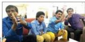
۲ صبحگاه ۱ ساعت در دست فرزندان برای راز و نیاز فرزند عملیات نجات «جاشو»ها از سومالی

صنعت نفت خانه های خود را بسازند فعالیت های مردمی را در کشور در حوزه جذب سرمایه خارجی به جهت توسعه تولیدات بخش انرژی کشور. خبرگزاری را فراهم کرده است که بیش از پیش به ظرفیت ها و توان داخلی چشم